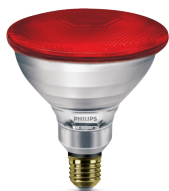
PAR38 IR E27 Red