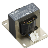
Coded Mains Receiver Adaptor