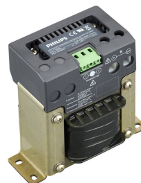
Coded Mains Transformer LN