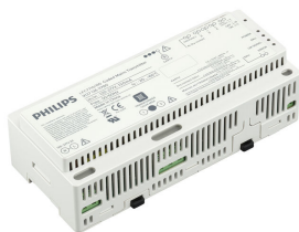
Coded Mains Transmitter