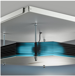
UV-C upper air CM SM355C SMB-DPP03