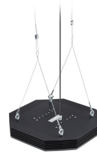
UV-C disinfection upper air suspended version