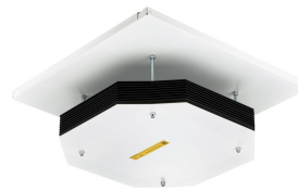
UV-C upper air CM SM355C SMB