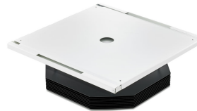
UV-C upper air CM SM355C SMB-DPP02