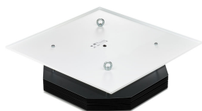
UV-C upper air CM SM355B- DPP02