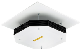
UV-C upper air CM SM355B