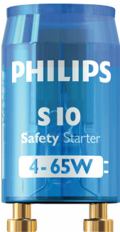
LPPR STARTER PHL 0003