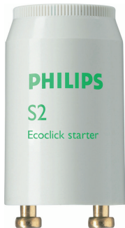
LPPR STARTER PHL 0004