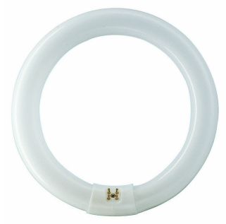
LPPR TL-E8 G10q