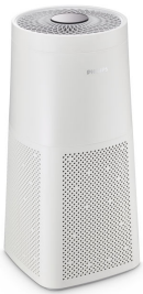
UVCA200 UV-C Floor standing air unit