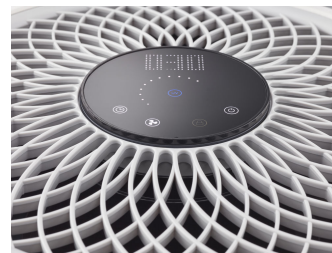
UVCA200 UV-C Floor standing air unit