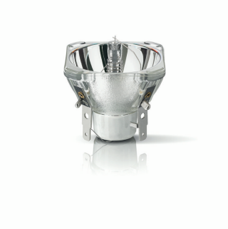
XPPR XDMSD 0010